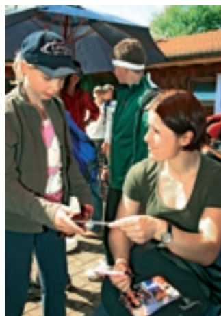
Uschi Disl verteilt Autogramme