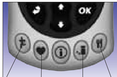
Attività fisica Salute Terapia Cibo

Premere lo SmartButton™ per digitare un'annotazione del diario (attività fisica, stato di salute, terapia o cibo).